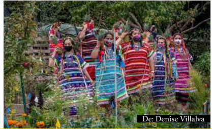
De: Denise Villalva

Este artículo fue compartido por el Northcoast Environmental Center para su publicación en La Semilla. PG&E ofrece estas sugerencias